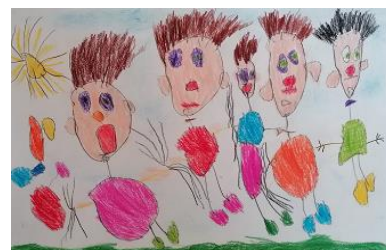
Risba iz arhiva vrtca