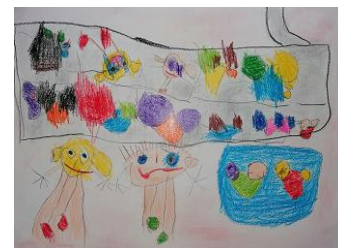
Risba iz arhiva vrtca