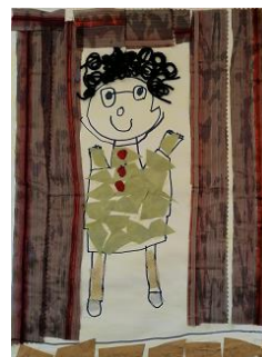
Risba iz arhiva vrtca