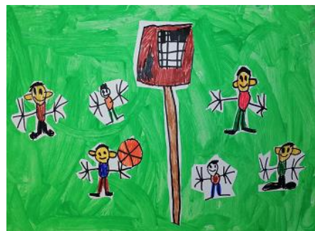
Risba iz arhiva vrtca