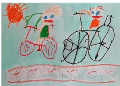
Risba iz arhiva vrtca