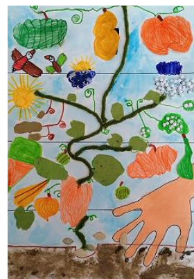
Risba iz arhiva vrtca