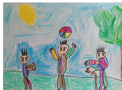
Risba iz arhiva vrtca

Oddelek vodita vzgojiteljica predšolskih otrok in vzgojiteljica predšolskih otrok - pomočnica vzgojiteljice. V oddelkih I. starostnega obdobja je sočasna prisotnost strokovnih delavk 6 ur, v oddelkih II. starostnega obdobja 4 ure in kombiniranih oddelkih 5 ur dnevno. V skladu z možnostmi bomo izvajali nadomeščanje odsotnih delavcev (podjemne pogodbe, študentski servis).