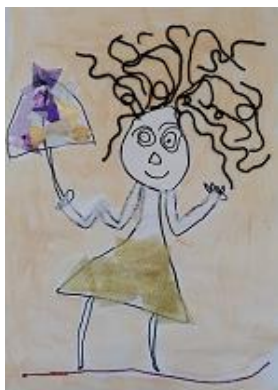
Risba iz arhiva vrtca

Šolske storitvene dejavnosti PETKA Žalec - Ulica Ivanke Uranjek 2, 3310 Žalec