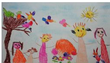
Risba iz arhiva vrtca

Strokovna izhodišča: Kurikulum za vrtce, Priročnik h Kurikulu, Kakovost v vrtcih (metodologija), Vrtec in šola v ogledalu, Vzgoja in učenje predšolskih otrok, Kodeks etičnega ravnanja, Književna vzgoja v vrtcu (T.