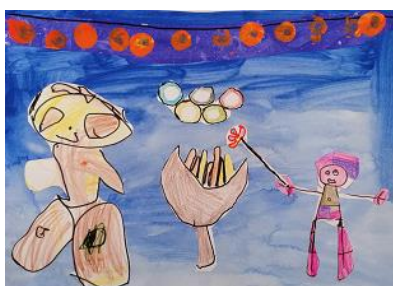
Risba iz arhiva vrtca

Metodologija temelji na na otroka osredinjenem pristopu , ob zagotavljanju kakovostnega izvajanja predšolskega kurikula in jo potrjuje tudi resorno ministrstvo. Strokovne delavke so bile vključene v uvodne izobraževalne seminarje. Srečanja na nivoju zavoda bodo potekala 3-krat letno po urniku srečanj za tekoče šolsko leto. V okviru mreže se bomo udeleževali aktivnosti, ki jih organizira Center za kakovost vzgoje in izobraževanja za vodstvene in vodilne delavce ter interni program zavoda (osnovni program).