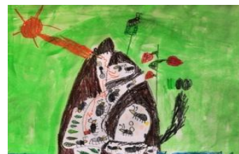
Risba iz arhiva vrtca

udeležence: na študijska srečanja se je prijavilo 20 strokovnih delavk, 2 svetovalni delavki ter pomočnica ravnateljice