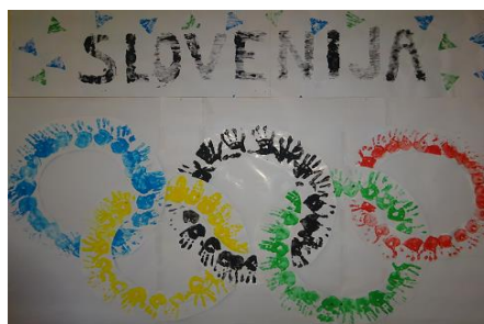
Risba iz arhiva vrtca

kakovostne pogoje (kreativne, učinkovite, uspešne) in v katerih odzivih se odraža razvojni napredek otrok, kultura odnosov.