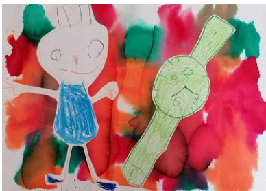
Risba iz arhiva vrtca

V tem šol. letu (september) je evidentiranih dvajset otrok s posebnimi potrebami, za enega je podan predlog za pridobitev dodatne strokovne pomoči v vrtcu.