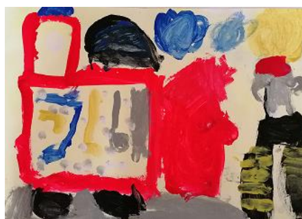
Risba iz arhiva vrtca