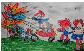
Risba iz arhiva vrtca