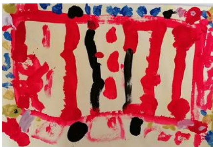
Risba iz arhiva vrtca