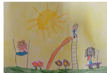
Risba iz arhiva vrtca