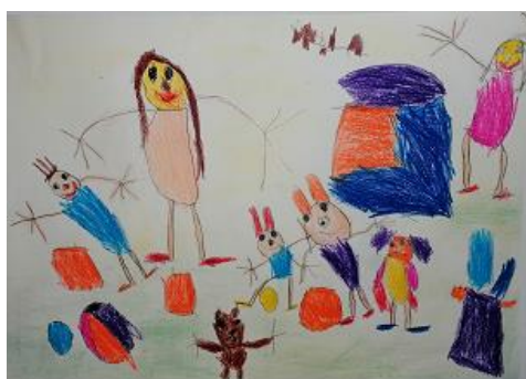
Risba iz arhiva vrtca

Zaposleni planirajo letni dopust za tekoče leto v maju. Pri tem se upošteva zakonodaja in dogovori v zvezi s koriščenjem.