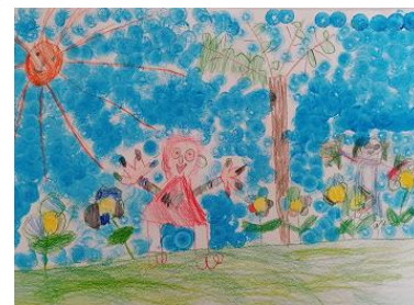
Risba iz arhiva vrtca