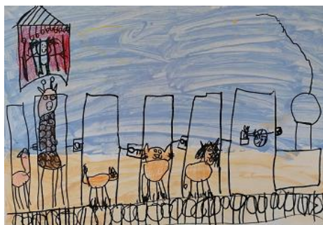
Risba iz arhiva vrtca